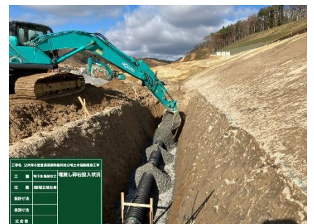
排水管等設置 (施工中)