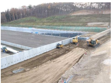
防災調整池の擁壁背面部の埋戻し (施工中)