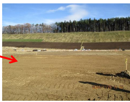
敷地造成工 (水処理施設用地の造成完了)