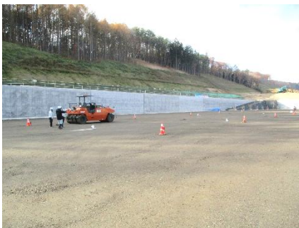
防災調整池舗装工 (施工中)